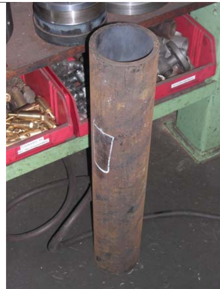
KSV und Abschlammventil hinten, Speiseventile vorn Rechts: Rohr für Gruppenventil